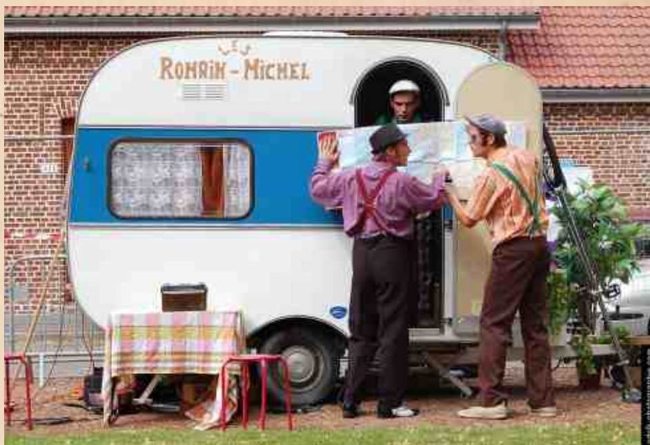
truc marqué sous les photos dans les journals

En effet, beaucoup de péripéties ont ponctué cette saison, riche en émotions, rencontres, et découvertes. Parmi ces bonnes surprises; les belles soirées guinguette du lac d'Aiguebelette, le festival des monts de la balle de Verriere en Forez (lauréats du tremplin rebond 2012!!), une tournée dans l'Aisne (et oui, il se passe des trucs dans l'Aisne!), la découverte de la recette de la Couilla de Moutou à Bénévent l'Abbaye (couille de mouton), le bon pineau d'Availles Limouzine et bien d'autres encore!! Même les gars de la presse ils se sont bien marrés; en plus d'avoir fait l'effort de se déplacer les dimanches ou jours fériés, ils ont dit des trucs du genre "c'était bien", c'était marrant"...Mais l'aventure ne