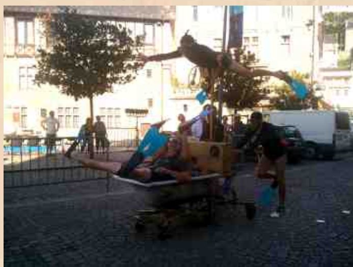
le commando guimauve à Tulle

Armés d'une baignoire mobile et d'un amour incontesté pour la poésie, ces plongeurs n'hésitent pas une seconde à se mouiller, des profondeurs de leur baignoire jusqu'aux points culminants du relief urbain. Une déferlante de bonheur, une vague de plaisir, fraîche et iodée qui réveillera ce vieux rêve au fond de vous, plongez ! Plus d'infos sur